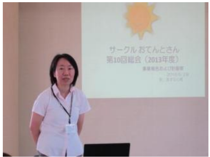
清水代表のあいさつ