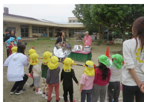
都南保育園 10/21 ソーラークッカー