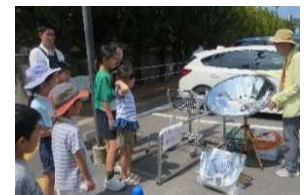
コープたつたがわ店にて 8/5 ソーラークッカー