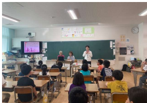
ならやま小学校 10/8 フードマイレージ