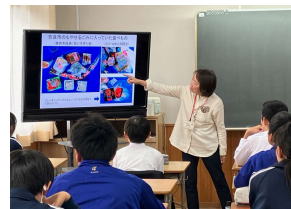
都祁中学校 11/24 食品ロス