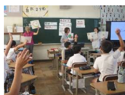
耳成西小学校 9/30 食品ロス