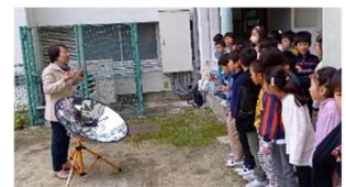
青和小学校 11/13 ソーラークッカー