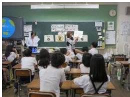
耳成小学校 6/17 地球温暖化