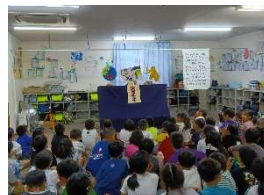
みみなし学童 7/17 ペープサート